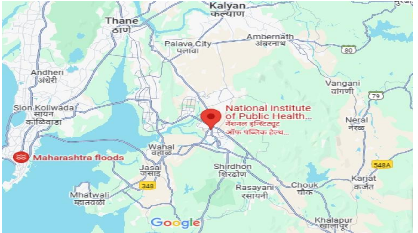
चित्र 1.1: एनआईपीएचटीआर की स्थिति दर्शाने वाला मानचित्र